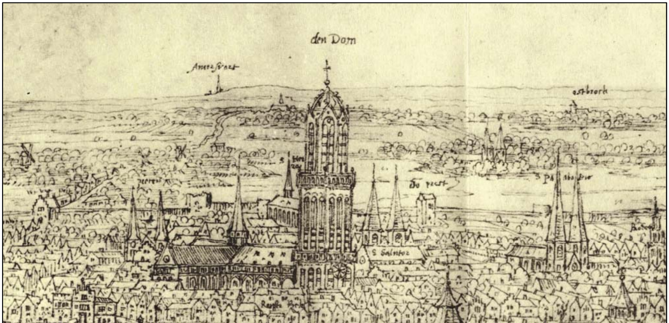
Figuur 2. Blik op De Bilt rond 1558. Links leidt de Steenweg van de Wittevrouwenpoort langs twee molens en de Gildpoort naar het Vrouwenklooster dat met een torentje boven enige bosschages uitsteekt. Daarachter zien we de Amersfoortse berg. Rechts van de Domtoren staat buiten de stad met dubbele torens het klooster Oudwijk en wat verder de abdijkerk van Oostbroek.