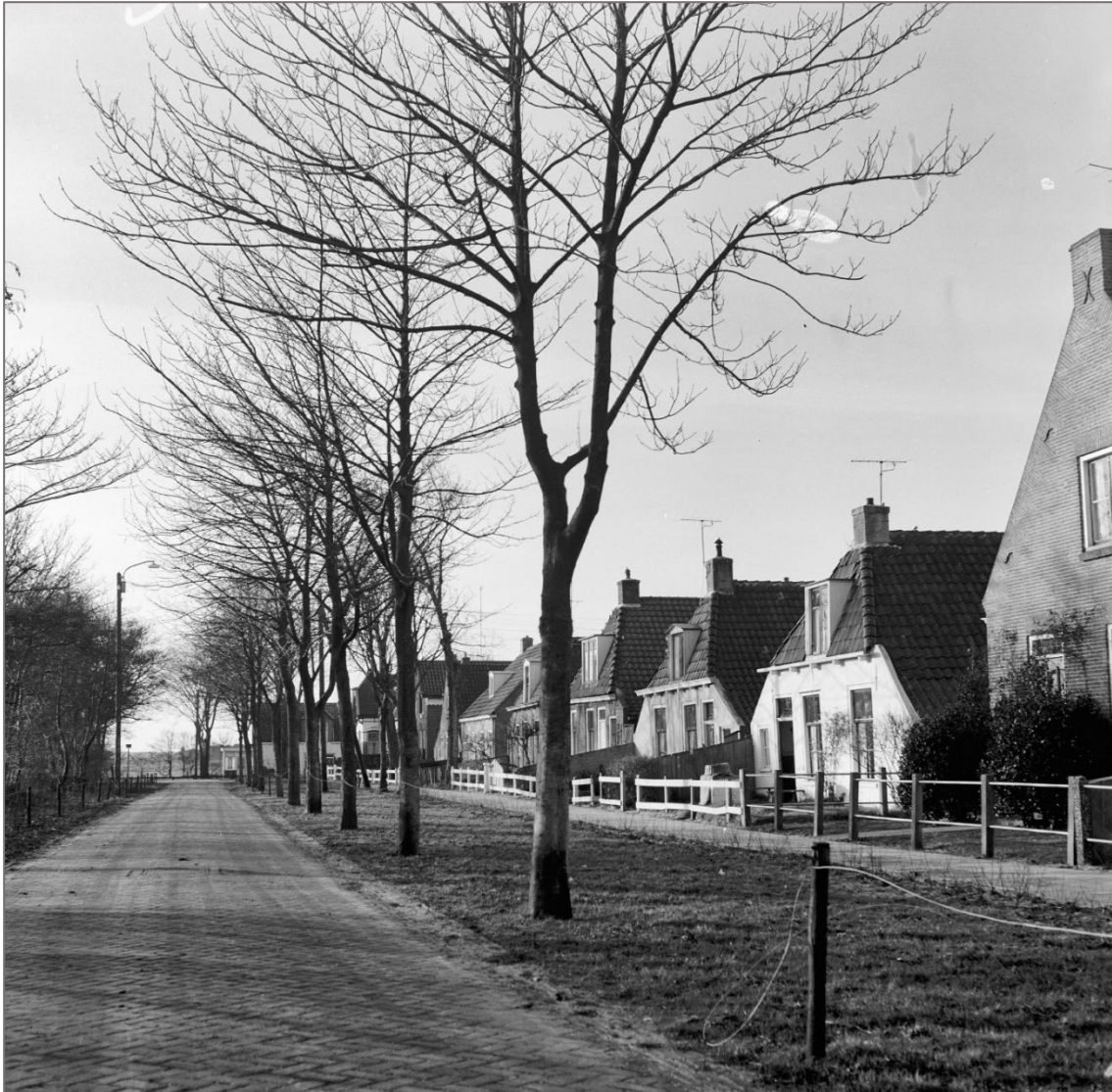
Het Westeinde van de Langestreek in 1964. Langestreek 132 is het derde huis van rechts.

Het eilanderhuis aan de Langestreek 132 is meer dan twee eeuwen oud en heeft veel meegemaakt. Bewoners kwamen en gingen, schippers, stuurlieden en matrozen die vooral op zee waren, lichtwachters en arbeiders, vrouwen met kinderen waarvan de man en vader op zee bleef en die het als weduwe moesten zien te redden als werkvrouw of met een winkeltje. En als de ouderdom kwam was men aangewezen op kinderen en familie. We zien in het huis de families Carst, Orre, Teensma, Onnes en de Jong. Bekende namen in een kleine gemeenschap met veel verwantschappen. Zo toont de geschiedenis van een eilanderhuis dat soms enkel en soms dubbel werd bewoond met ook nog inwoning, iets van een samenleving waarin het leven niet gemakkelijk was. De ouderdom van het huis is zichtbaar aan de architectuur, maar binnen ook voelbaar door de massieve zware liggers die de zolder schragen. Het inspireerde tot een verhaal over de bouw, de bewoners, en alle veranderingen, van schipperswoning tot vakantiehuis. In deze bijdrage bespreken we de constructie