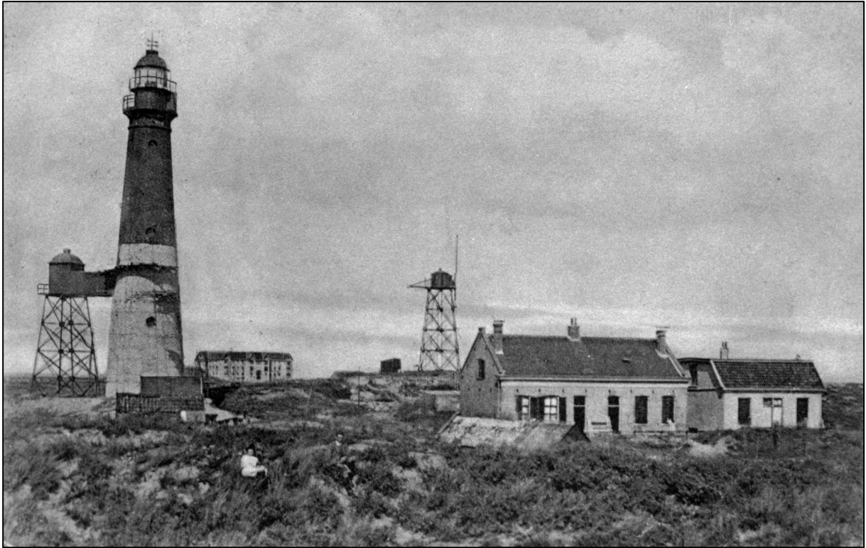
De Fierst Túer met kleine kaap en grote kaap in 1911, met meest links de lichtwachterswoning waar Feye de Groot vanaf 1914 woonde.

Op 1 november 1939 ging Feye met pensioen en verhuisde het echtpaar de Groot naar Langestreek 132. Hij huurde de eerste jaren het hele huis van Klaas Onnes, wiens stiefvader Feye Rademaker zijn oom was. In het achterhuis had Anna Beukema in de beginjaren een winkeltje. In 1950 kocht Feye het huis. Eddie Bakker kwam regelmatig langs bij zijn grootouders in het buurhuis Langestreek 130 en weet nog: Feye heeft nog 25 jaar van zijn pensioen mogen genieten. Hij was een verwoed visser met het botwand en kon ook goed een stuk wild verschalken. Het botwand is een lijn met haken waaraan pieren werden gestoken en die met eb op het strand werd vastgezet. Feye wist precies waar de meeste bot te vangen was. Bij de volgende eb werd de vangst binnen gehaald. En als er kinderen meegingen en een bot zagen dan moesten ze er op gaan staan zodat Feye die kon pakken. Volgens Eddie's vader Foppe, die goed bevriend was met Feye, zei hij: "wat is der lekkerder as ín eilauwnder bratbot (een gebakken bot)".