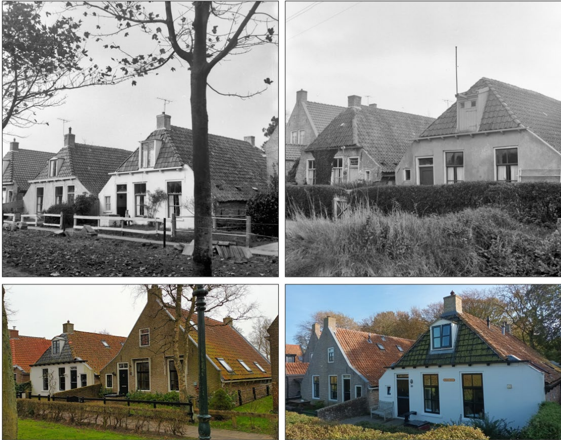
Langestreek 132 en 130 in 1963 (boven) en 2024 (onder), voor (links) en achter (rechts). Door spiegeling is de voor- en achterzijde van de combinatie van beide huizen in 1963 opvallend vergelijkbaar. Nummer 130, gemeentelijk eigendom en ooit bedoeld als Oudheidkamer, is in 1974 gerestaureerd en kreeg zowel voor als achter weer een rechte topgevel.